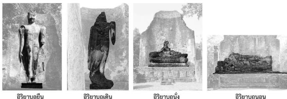
ภาพที่ ๓๙ แสดงภาพปฏิมากรรม “พระสี่อิริยาบถ” วัดพระสี่อิริยาบถ เมืองกำแพงเพชร ๑๓๖

ปฏิมากรรม “พระสี่อิริยาบถ” ปรากฏอยู่ในโบราณสถานเขตพุทธาวาสของวัดพระสี่อิริยาบถ เป็นอาคารที่เรียกว่า มณฑป กล่าวคือ อาคารดังกล่าวประดิษฐานพระพุทธรูปยืนอยู่ด้านทิศตะวันตก พระพุทธรูปเดินอยู่ด้านทิศตะวันออก (ด้านหน้า) พระพุทธรูปนั่งอยู่ทางด้านทิศใต้ ส่วนพระพุทธรูปนอนอยู่ทางด้านทิศเหนือ (ซึ่งต่างจากวัดเชตุพนที่พระพุทธรูปในอิริยาบถนอนอยู่ทางด้านทิศใต้ ส่วนพระพุทธรูปในอิริยาบถนั่งอยู่ทางด้านทิศเหนือ) (ดูภาพ ๓๙)