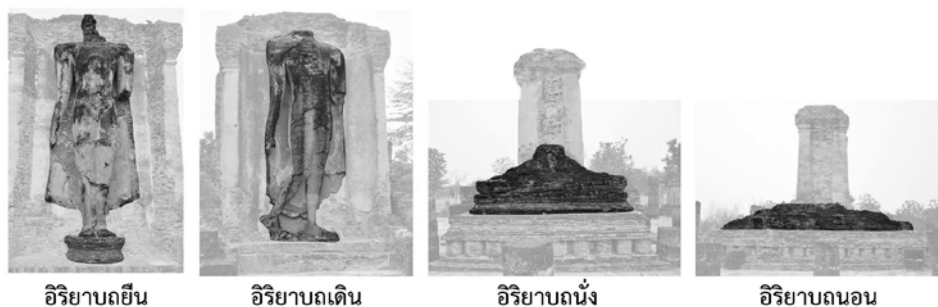
ภาพที่ ๓๘ แสดงภาพปฏิมากรรม “พระสี่อิริยาบถ” วัดเชตุพน เมืองเก่าสุโขทัย ๑๓๕

ปฏิมากรรม “พระสี่อิริยาบถ” ปรากฏอยู่ในโบราณสถานเขตพุทธาวาสของวัดเชตุพน เป็นอาคารที่เรียกว่า มณฑป ซึ่งเป็นอาคารประธานของวัดแห่งนี้ มณฑปหลังนี้ทำเป็นที่ประดิษฐานพระพุทธรูป ที่เรียกว่า “พระสี่อิริยาบถ” กล่าวคือ มีพระพุทธรูปในอิริยาบถยืนอยู่ทางด้านทิศตะวันตก มีพระพุทธรูปเดินอยู่ทางด้านหน้าทิศตะวันออก พระพุทธรูปในอิริยาบถนั่งอยู่ทางด้านทิศเหนือ ส่วนมีพระพุทธรูปในอิริยาบถนอนอยู่ทางด้านทิศใต้ (ดูภาพ ๓๘)