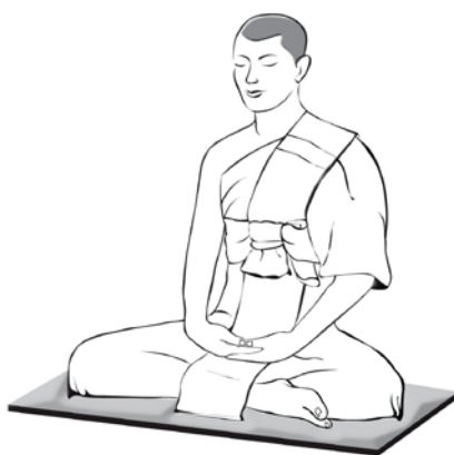
ภาพที่ ๔๑ แสดงภาพอิริยาบถนั่ง ๑๕๗

การนั่งกำหนดอาการฟอง-ยุบของท้อง จัดเป็นอิริยาบถนั่ง อยู่ในหมวดสัมปชัญญะ และธาตุมนสิการ ลักษณะของท่าที่นั่งนี้มี ๓ แบบ คือ ๑) ท่านั่งแบบขัดสมาธิ [แบบพระพุทธรูป] หรือเรียกว่า ขัดสมาธิเพชร ๒) ท่านั่งแบบซ้อนขา (ขัดสมาธิราบ) คล้ายแบบแรก แต่ใช้ขาขวาวางซ้อนทับบนขาซ้าย ๓) ท่านั่งแบบเรียงขา คล้ายแบบที่สอง แต่จะวางขาเรียงกันกับพื้น ให้เท้าใดเท้าหนึ่งอยู่ด้านนอก มีข้อดีคือ เกิดทุกขเวทนาได้ช้ากว่าเพราะ ไม่ได้วางขาทับซ้อนกัน ๑๕๘