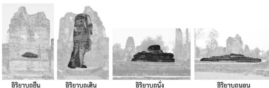
ภาพที่ ๓๗ แสดงภาพปฏิมากรรม “พระสี่อิริยาบถ” วัดพระพายหลวง เมืองเก่าสุโขทัย ๑๓๔

ปฏิมากรรม “พระสี่อิริยาบถ” ปรากฏอยู่ในโบราณสถานในเขตพุทธาวาสของวัดพระพายหลวง ซึ่งเป็นโบราณสถานที่ตั้งเยื้องออกมาทางด้านทิศใต้ของแนวแกนประธานถัดออกมาทางด้านหน้ากลุ่มศาสนสถานที่เป็นเจดีย์รูปสี่เหลี่ยม อาคารหลังนี้เมื่อมีการขุดแต่งโบราณวัตถุ เมืองเก่าสุโขทัย ถูกเรียกว่า มณฑป ก่อสร้างด้วยอิฐถือปูน มีพระพุทธรูปปูนปั้นขนาดใหญ่ โดยด้านหน้าทิศตะวันออกเป็นพระพุทธรูปเดิน ๑๓๓ ด้านข้าง ๒ ข้างเป็นพระพุทธรูปยืน ขนาดย่อม [สันนิษฐานว่าเป็นพุทธสาวกเบื้องขวาและเบื้องซ้าย] ด้านละ ๒ องค์ ส่วนด้านหลังสันนิษฐานว่าเป็นพระพุทธรูปยืนอีก ๑ องค์ [ชำรุดหมด คงมีเหลือเพียงแค่ฐาน] (ดูภาพ ๓๗)